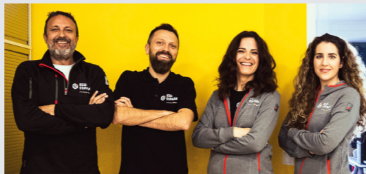
Su contacto: Equipo Iberia - Oficina Montilla (Córdoba)

Nacidos de una tradición automovilística de más de 100 años, llevamos 25 años realizando pruebas y reparaciones de electrónica de control defectuosa de automóviles. El trabajo en los dispositivos defectuosos se realiza en nuestro moderno laboratorio de Alemania. Con nuestros 200 empleados y unos 100.000 clientes en todo el mundo, somos uno de los líderes del mercado europeo en este segmento.